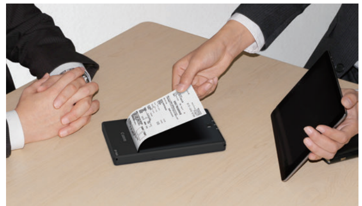
各種スマートデバイスに対応。外出先でワイヤレス印刷。