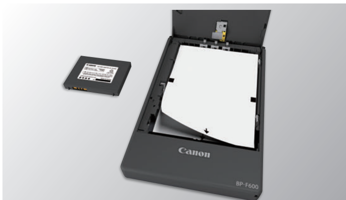
外出前の用紙補充でお客様先での用紙切れ・補充作業を回避。外出先でのバッテリー交換にも対応。(別途購入が必要です)