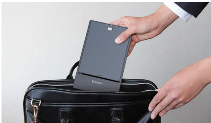
薄型の軽量ボディを実現。カバンの中にスッキリ収納。

※1 バッテリーカバーを突起物として扱わない場合は、幅 130mm・奥行き 205mm・厚さ 19.9mm。 ※2 Bluetooth はその権利者が所有している商標であり、キヤノン電子株式会社はライセンスに基づき使用しています。 ※3 USB 接続は Windows のみ対応です。 ※4 25℃環境下において、満充電状態の新品充電電池で USB から所定の印字率で連続印刷した場合。 ※5 Windows は、米国 Microsoft Corporation の米国およびその他の国における登録商標です。 ※6 Android は Google Inc. の商標です。 ※7 iOS は、米国およびその他の国における Cisco の商標または登録商標であり、ライセンスに基づき使用されています。 ※8 Android、iOS の対応は、SDK によりアプリケーション開発が必要です。 ※9 iOS は対応予定です。 ※10 切取用紙、複写用紙は発売予定。 ※11 消耗品はキヤノン純正品のご使用をお薦めします。 ※ 記載された仕様は、改良のため予告なく変更する場合があります。予めご了承ください。