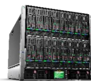
• BL460c Gen10 • BladeSystem c7000エンクロージャー