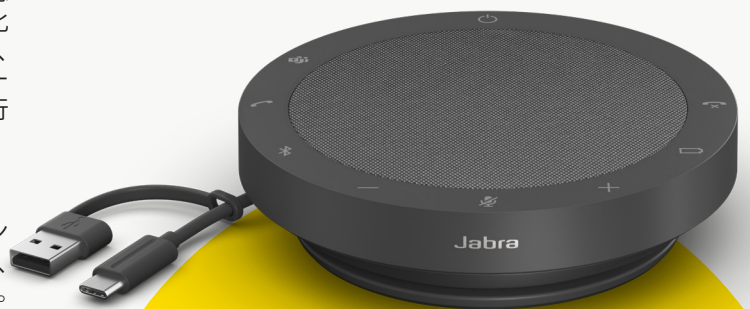
MS TEAMS & UC 対応モデル

Jabra は、製品開発のあらゆる段階でサステナビリティについてもしっかり検討しています。Speak2 55 のケースは、50% 以上にサステナブルな素材**を使用しており、内蔵部品の多くも修理や交換が可能です。高いサステナビリティ=長いスピーカー寿命=あなたやチームにとって、より高品質で生産性の高い通話を実現します。