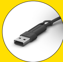
USB-C と USB-A コネクタ同梱