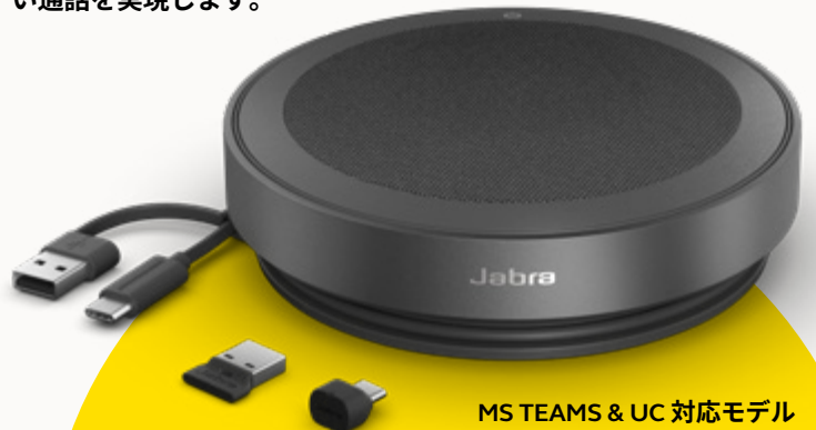
MS TEAMS &amp; UC 対応モデル

地球に配慮するため、Jabra は、製品開発のあらゆる段階でサステナビリティについてもしっかりと検討しています。Speak2 75 のケースは、33% 以上にサステナブルな素材 3 を使用しており、内蔵部品の多くも修理や交換が可能です。 高いサステナビリティ=長いスピーカー寿命=あなたやチームにとって、より高品質で生産性の高い通話を実現します。