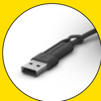
USB-C と USB-A コネクタ同梱