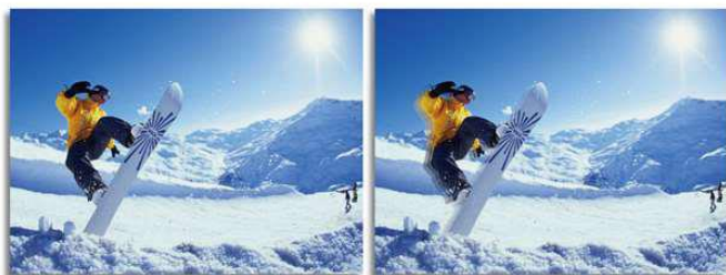
Smart Responseオン Smart Responseオフ